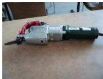
Schabmaschine 10 Punkte pro /Zoll