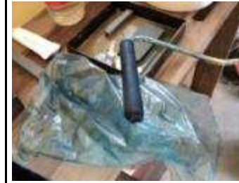
Touchier Rolle immer in einem sauberen Plastik Sack vor dem Schmutz schützen