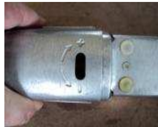
Hub Längen Einstellung 0- 20 mm