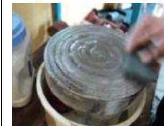
Dann mit dem Stein grosse Kreisbewegungen machen