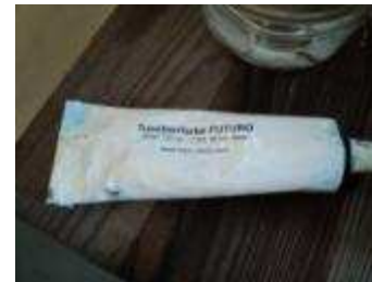
Touchierfarbe der Firma Brütsch Rüeegg