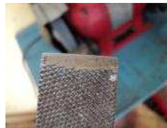
Ansicht einer geschliffener Feile