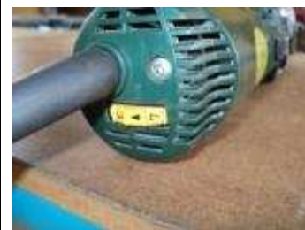
Hub Regulierung bis 1600 Hübe pro Minute