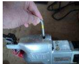
Mit dem 6 mm Inbus Hub einstellen