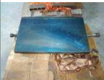
Touchierplatte 400 x 600 mm