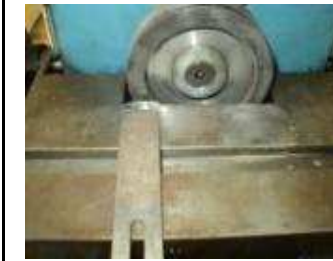
Diamant Schabmesserschleifmaschine 5 Grad Freiwinkel