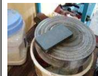
Danach den Stein gut waschen