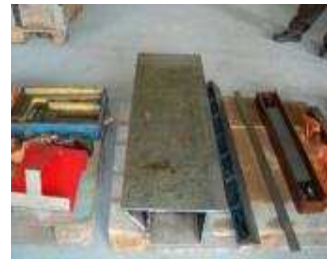
Grosser Lineal 400 mm breit. Für 20 Meter Maschinenbetten