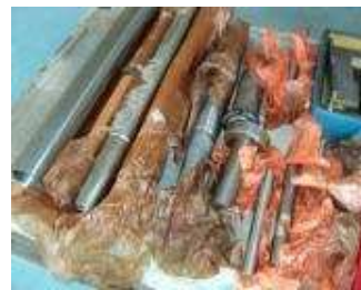
Div. geschliffene Wellen, teilweise mit Konen