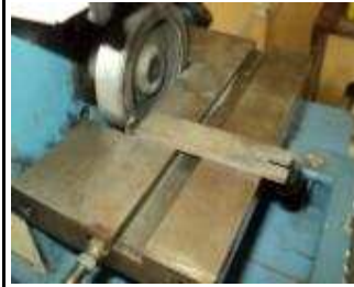
Kühlen mit Petrol. Nur 5 Gramm Anpressdruck