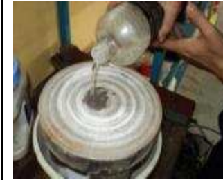
ca. 0,05 l Petrol auf den Abziehstein geben