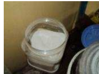
Quarzsand 0,1 mm