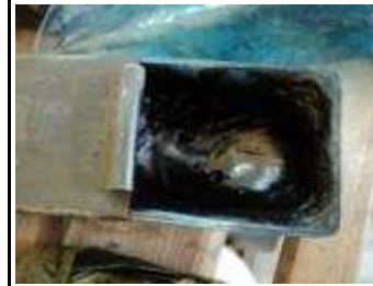
Offene Touchierfarbe in sauberer Dose