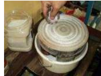
Abziehstein Reiniger mit Quarzsand bestreuen