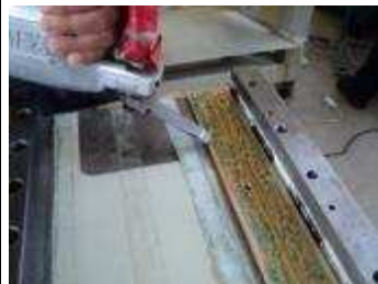
Schruppen 25° 7 mm Hub Schlichten 40° 2 mm Hub