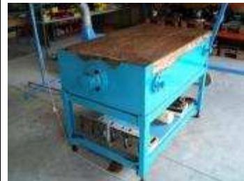
Touchierplatte 800 x 1200 mm