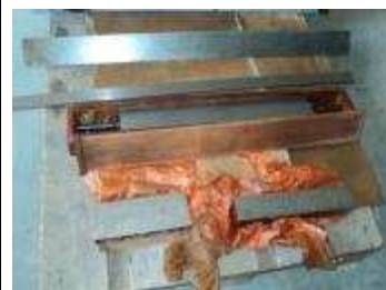
Diverse Touchierlineale auch für Schwalbenschwanz